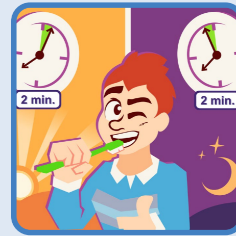
's ochtends en 's avonds 2 min