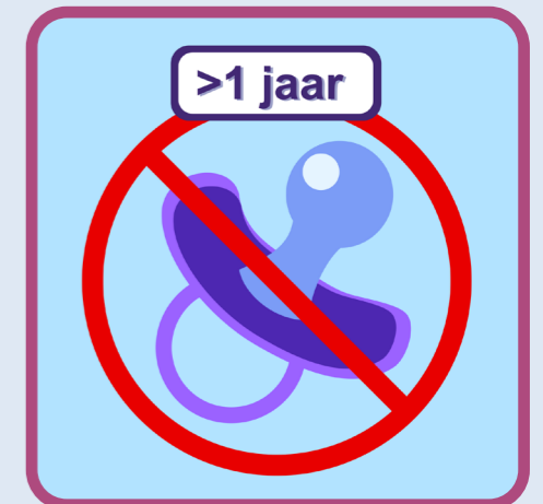
speengebruik stoppen na 1e verjaardag