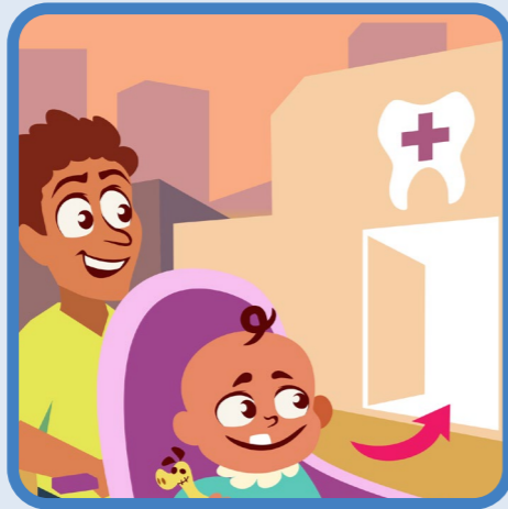
poetsen vanaf doorbraak 1e tand