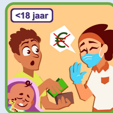
mondzorg tot 18 jaar is verzekerd