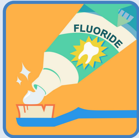
tandpasta met fluoride