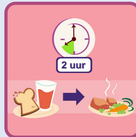
na eten of drinken minstens 2 uur niets meer