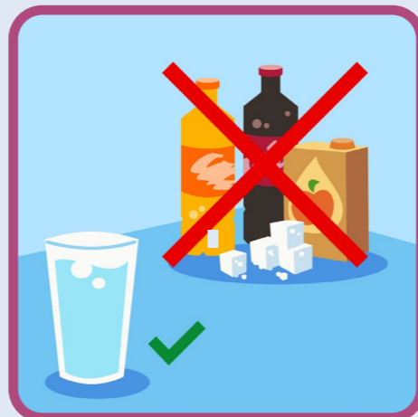
drink water/thee zonder suiker