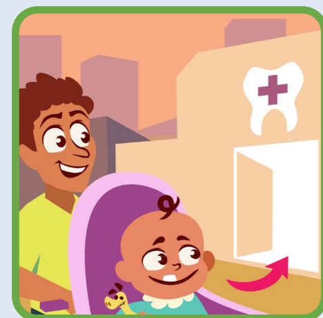
naar de tandarts vanaf 1e tand