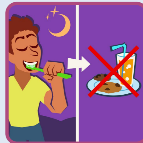
geen eten of drinken na laatste keer tandenpoetsen