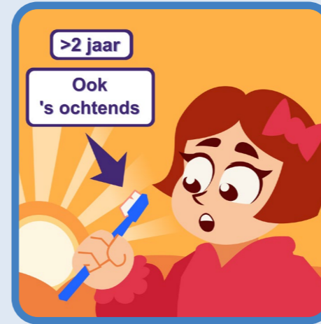
vanaf 2e verjaardag ook 's ochtends